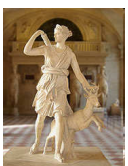
Artémis déesse de la chasse