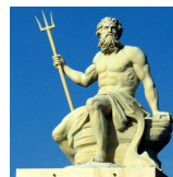
Poséïdon dieu des mers et des océans