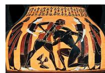
les 12 travaux d'Héraclès