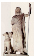
Hadès dieu des enfers