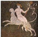
Dionysos dieu du feu et des métaux